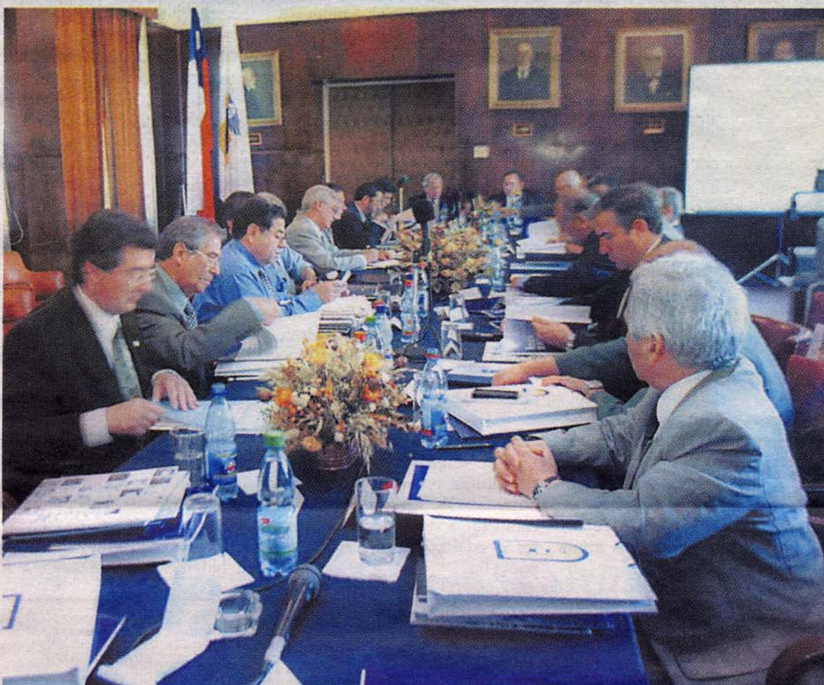
La reunión del Consejo de Rectores congregará a autoridades de las 25 universidades tradicionales del país.

Además, se tratarán temas propios de la entidad. La reunión del consejo de rectores de las 25 universidades tradicionales, tendrá lugar el jueves 11, desde las 09:00 horas, en la biblioteca del Campus Chinquihue.